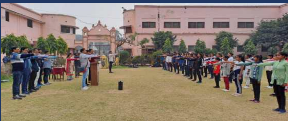
शासन के आदेश के क्रम में महाविद्यालय के रोवर्स रेंजर्स द्वारा महाविद्यालय में दिनांक 25 जनवरी 2024 को मतदाता जागरूकता अभियान, शपथ ग्रहण कार्यक्रम