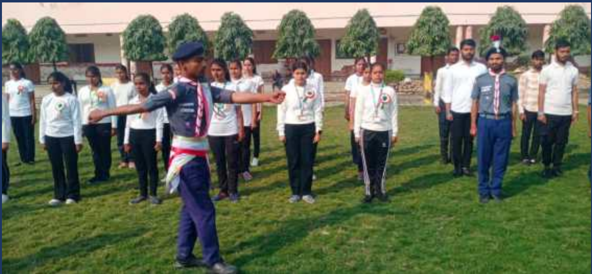
महाविद्यालय के रोवर्स रेंजर्स द्वारा महाविद्यालय में दिनांक 26 जनवरी 2025 को राष्ट्रीय पर्व गङ्गोत्री दिवस कार्यक्रम