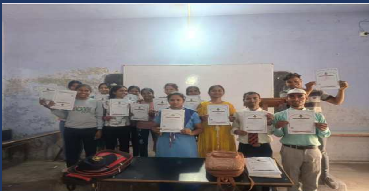
महाविद्यालय में संचालित पांच दिवसीय रोवर्स रेंजर्स प्रशिक्षण कार्यक्रम एवं निपुर्ण कैप दिनांक 27 फरवरी 2023 से 03 मार्च 2023 का प्रमाण पत्र वितरण