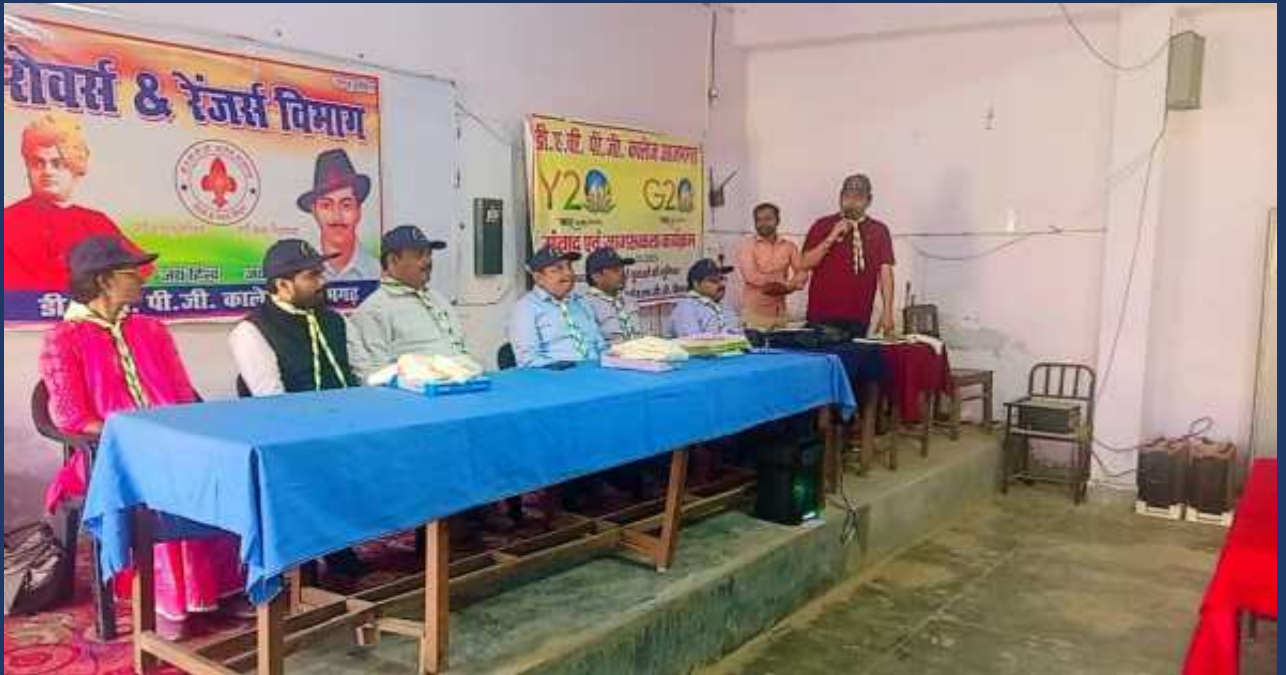
महाविद्यालय में पांच दिवसीय रोवर्स रेंजर्स प्रशिक्षण कार्यक्रम एवं निपुर्ण कैप दिनांक 27 फरवरी 2023 से 03 मार्च 2023 तक