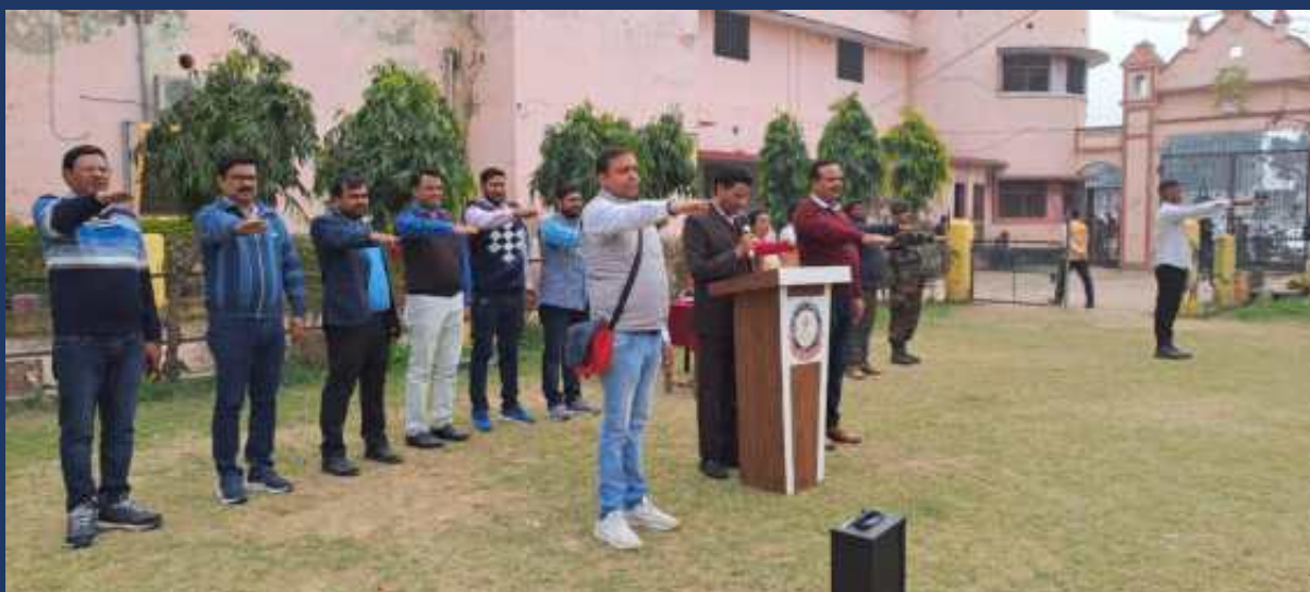
शासन के आदेश के क्रम में महाविद्यालय के रोवर्स रेंजर्स द्वारा महाविद्यालय में दिनांक 25 जनवरी 2024 को मतदाता जागरूकता अभियान, शपथ ग्रहण कार्यक्रम