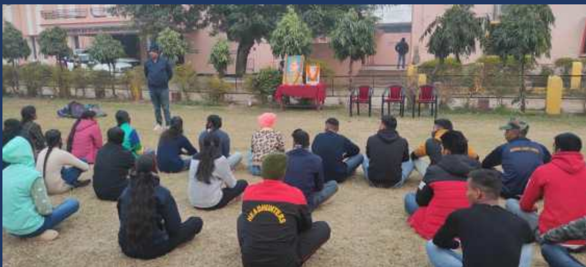
महाविद्यालय के रोवर्स रेंजर्स द्वारा महाविद्यालय में दिनांक 23 जनवरी 2023 को सुभाष चन्द्र बोस जयन्ती कार्यक्रम