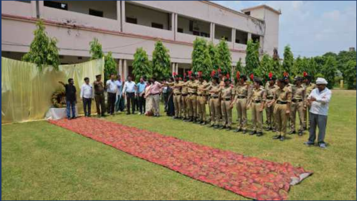
महाविद्यालय के रोवर्स रेंजर्स द्वारा महाविद्यालय में दिनांक 15 अगस्त 2023 को राष्ट्रीय पर्व स्वतंत्रता दिवस कार्यक्रम