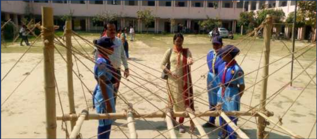
महाविद्यालय में पांच दिवसीय रोवर्स रेंजर्स प्रशिक्षण कार्यक्रम एवं निपुर्ण कैंप दिनांक 27 फरवरी 2023 से 03 मार्च 2023 तक