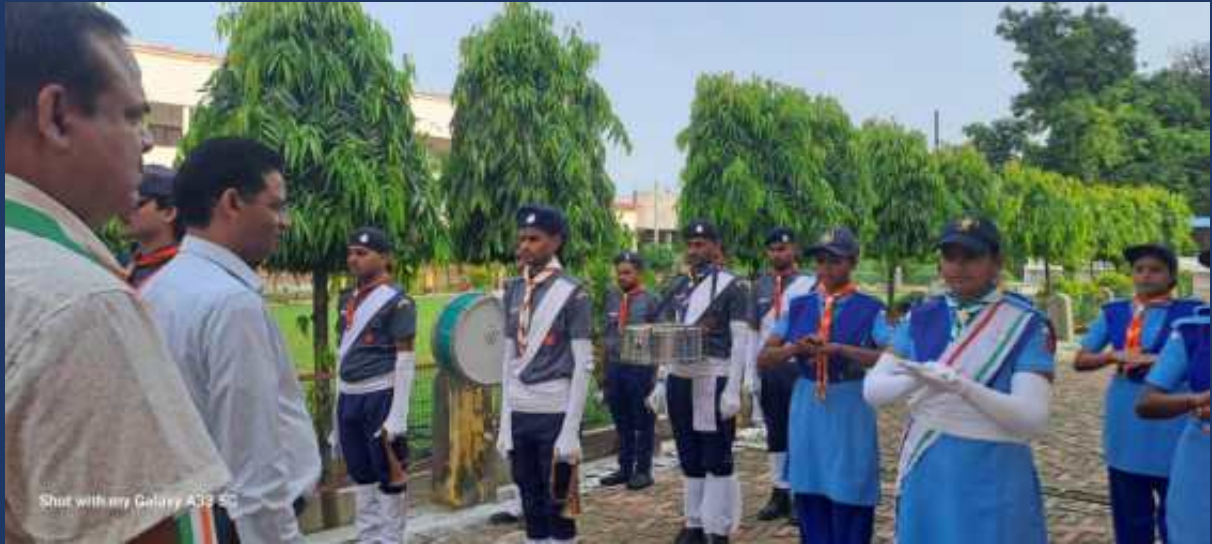
महाविद्यालय के रोवर्स रेंजर्स द्वारा महाविद्यालय में दिनांक 15 अगस्त 2024 को राष्ट्रीय पर्व स्वतंत्रता दिवस कार्यक्रम