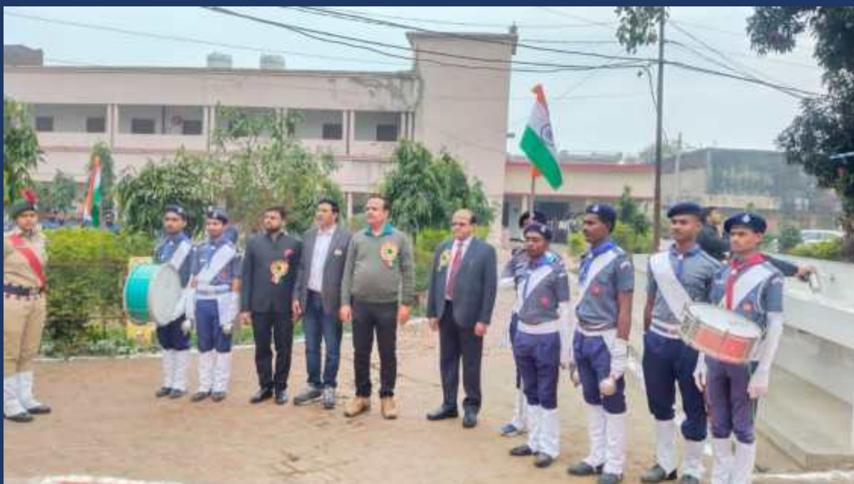
महाविद्यालय के रोवर्स रेंजर्स द्वारा महाविद्यालय में दिनांक 26 जनवरी 2023 को राष्ट्रीय पर्व गङ्गंतत्र दिवस कार्यक्रम