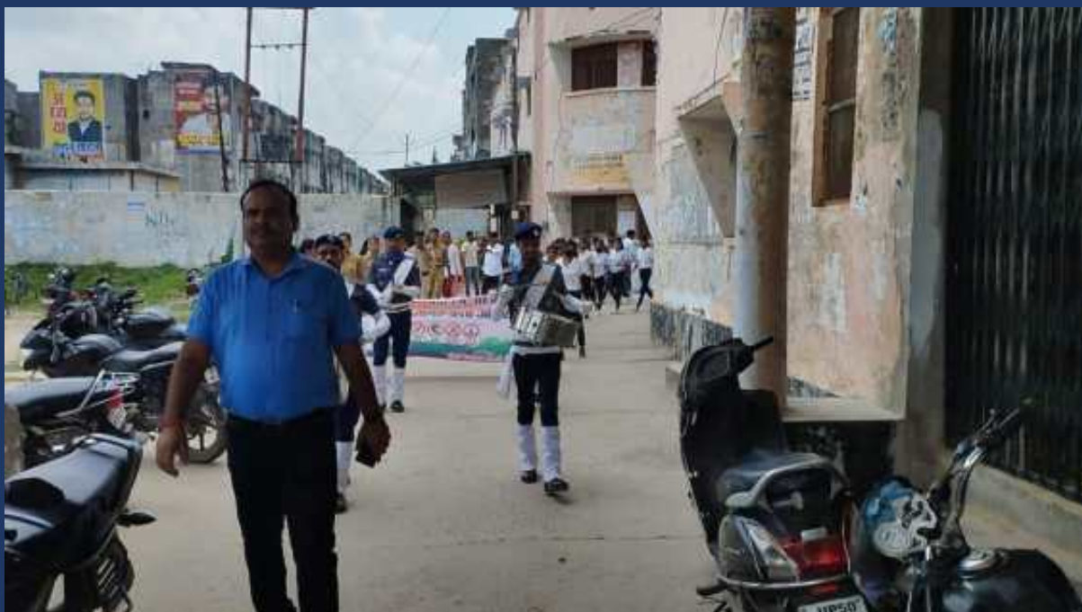
शासन के आदेश के क्रम में महाविद्यालय के रोवर्स रेंजर्स द्वारा महाविद्यालय में दिनांक 31 जुलाई २०२३ को सड़क सुरक्षा जागरूकता रैली कार्यक्रम