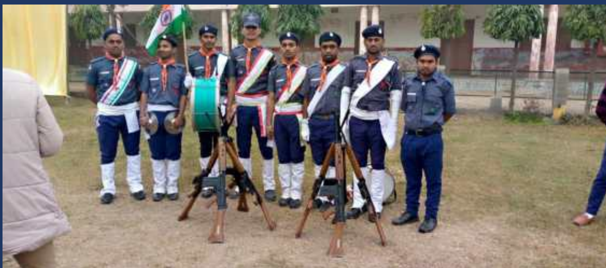
महाविद्यालय के रोवर्स रेंजर्स द्वारा महाविद्यालय में दिनांक 26 जनवरी 2023 को राष्ट्रीय पर्व गड्ढतंत्र दिवस कार्यक्रम