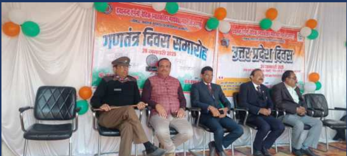
महाविद्यालय के रोवर्स रेंजर्स द्वारा महाविद्यालय में दिनांक 26 जनवरी 2025 को राष्ट्रीय पर्व गणतंत्र दिवस कार्यक्रम