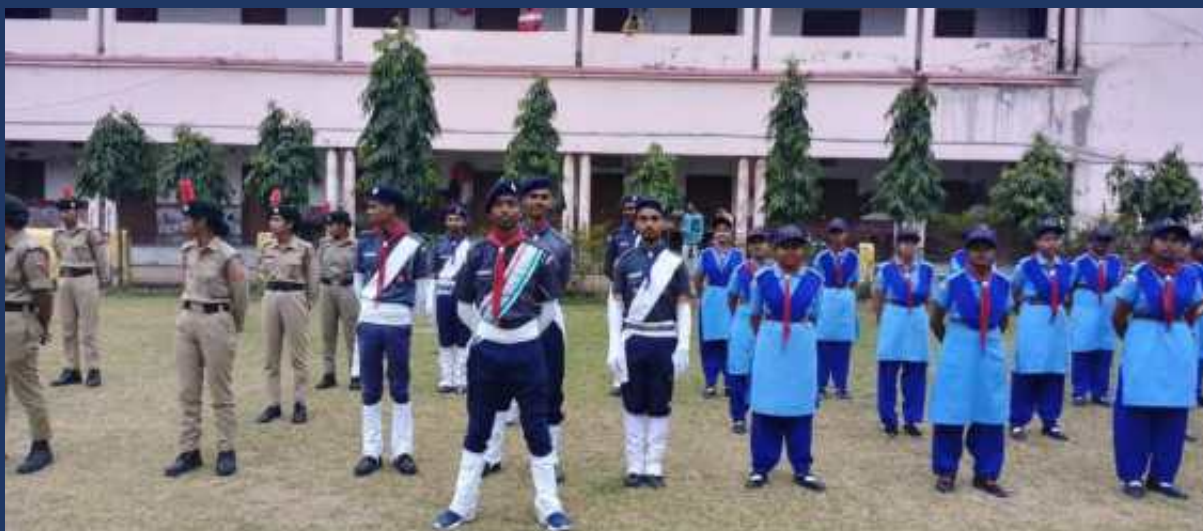
महाविद्यालय के रोवर्स रेंजर्स द्वारा महाविद्यालय में दिनांक 26 जनवरी 2023 को राष्ट्रीय पर्व गङ्गंतत्र दिवस कार्यक्रम