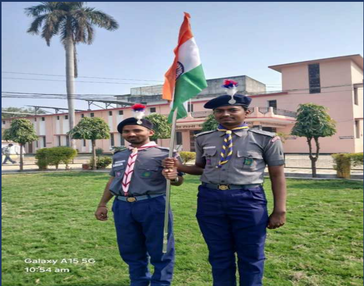
महाविद्यालय के रोवर्स रेंजर्स द्वारा महाविद्यालय में दिनांक 26 जनवरी 2025 को राष्ट्रीय पर्व गङ्गंतंत्र दिवस कार्यक्रम