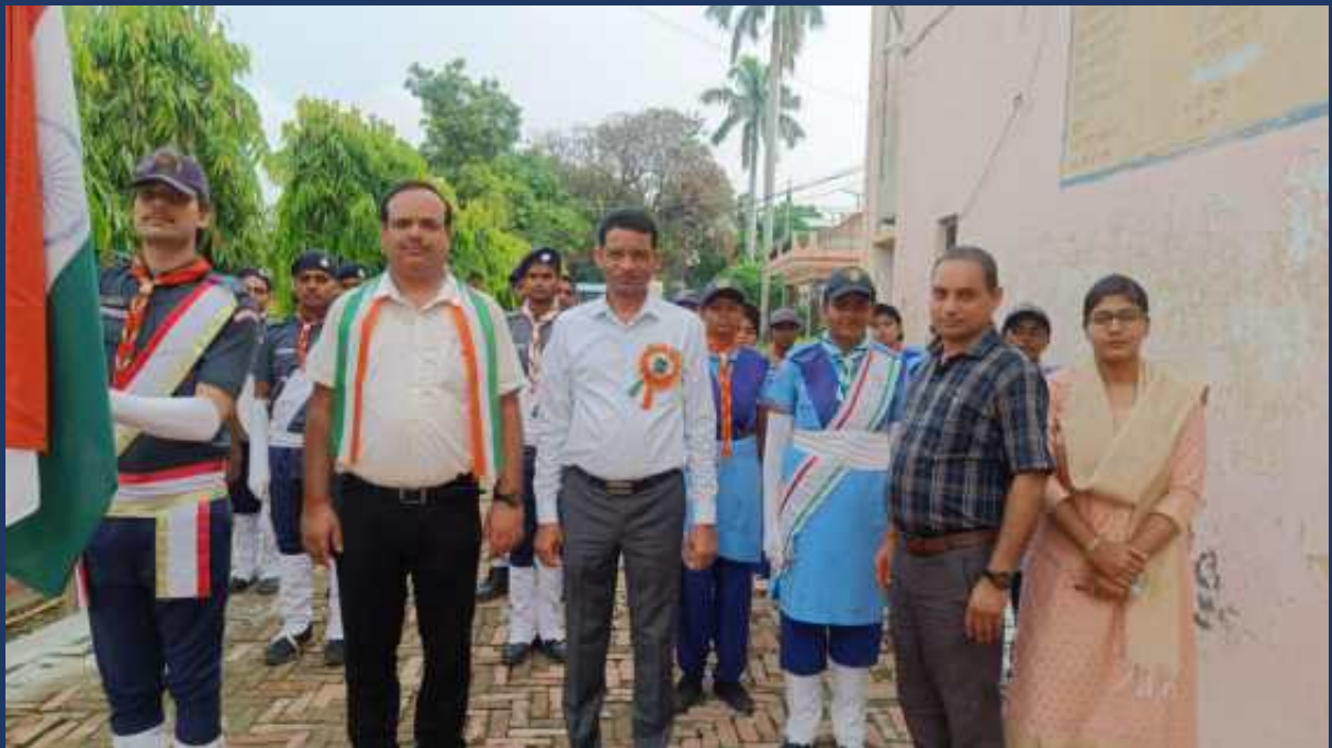
महाविद्यालय के रोवर्स रेंजर्स द्वारा महाविद्यालय में दिनांक 15 अगस्त 2024 को राष्ट्रीय पर्व स्वतंत्रता दिवस कार्यक्रम