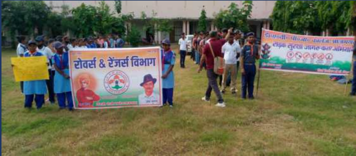
शासन के आदेश के क्रम में महाविद्यालय के रोवर्स रेंजर्स द्वारा महाविद्यालय में दिनांक 21 अक्टूबर २०२३ को सड़क सुरक्षा जागरूकता रैली कार्यक्रम