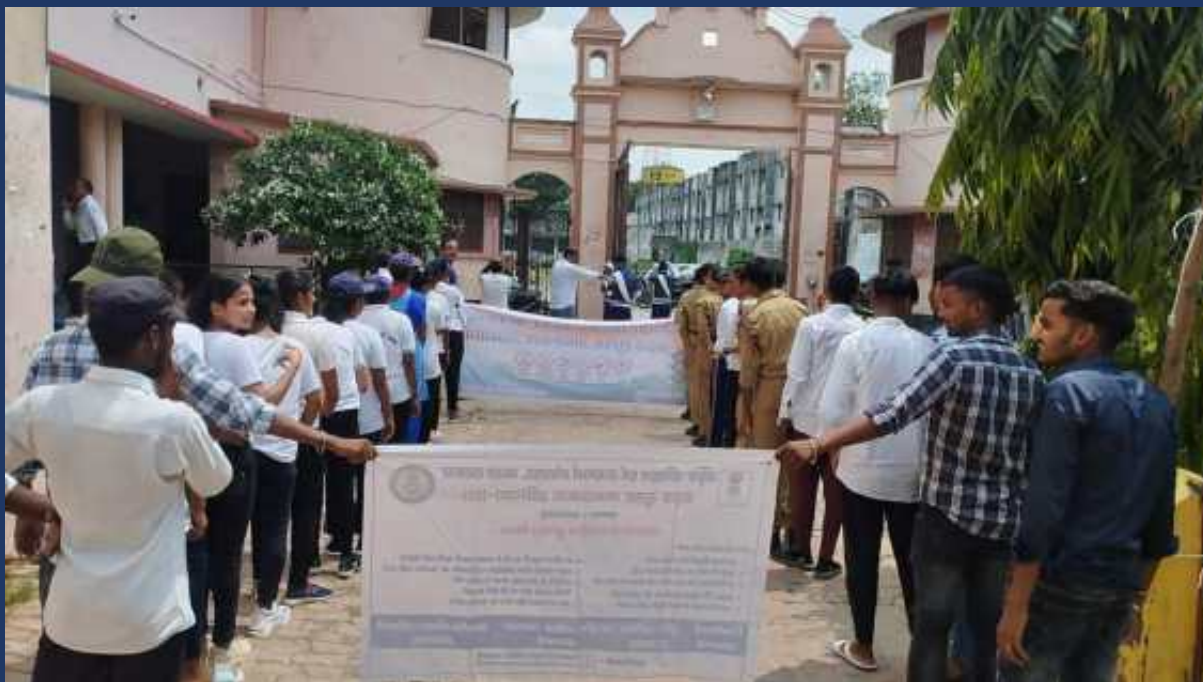
शासन के आदेश के क्रम में महाविद्यालय के रोवर्स रेंजर्स द्वारा महाविद्यालय में दिनांक 31 जुलाई २०२३ को सड़क सुरक्षा जागरूकता रैली कार्यक्रम