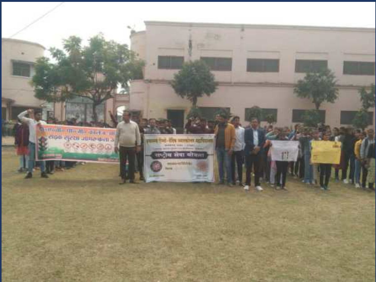
शासन के आदेश के क्रम में महाविद्यालय के रोवर्स रेंजर्स द्वारा महाविद्यालय में दिनांक 13 फ़रवरी २०२4 को सड़क सुरक्षा जागरूकता रैली कार्यक्रम