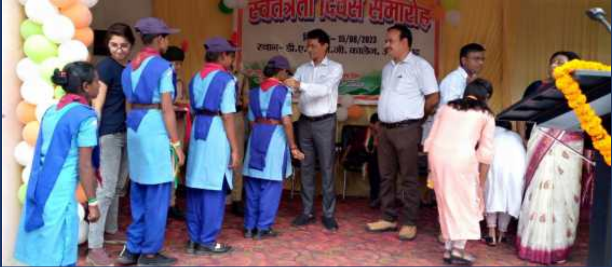
महाविद्यालय के रोवर्स रेंजर्स द्वारा महाविद्यालय में दिनांक 15 अगस्त 2023 को राष्ट्रीय पर्व स्वतंत्रता दिवस कार्यक्रम