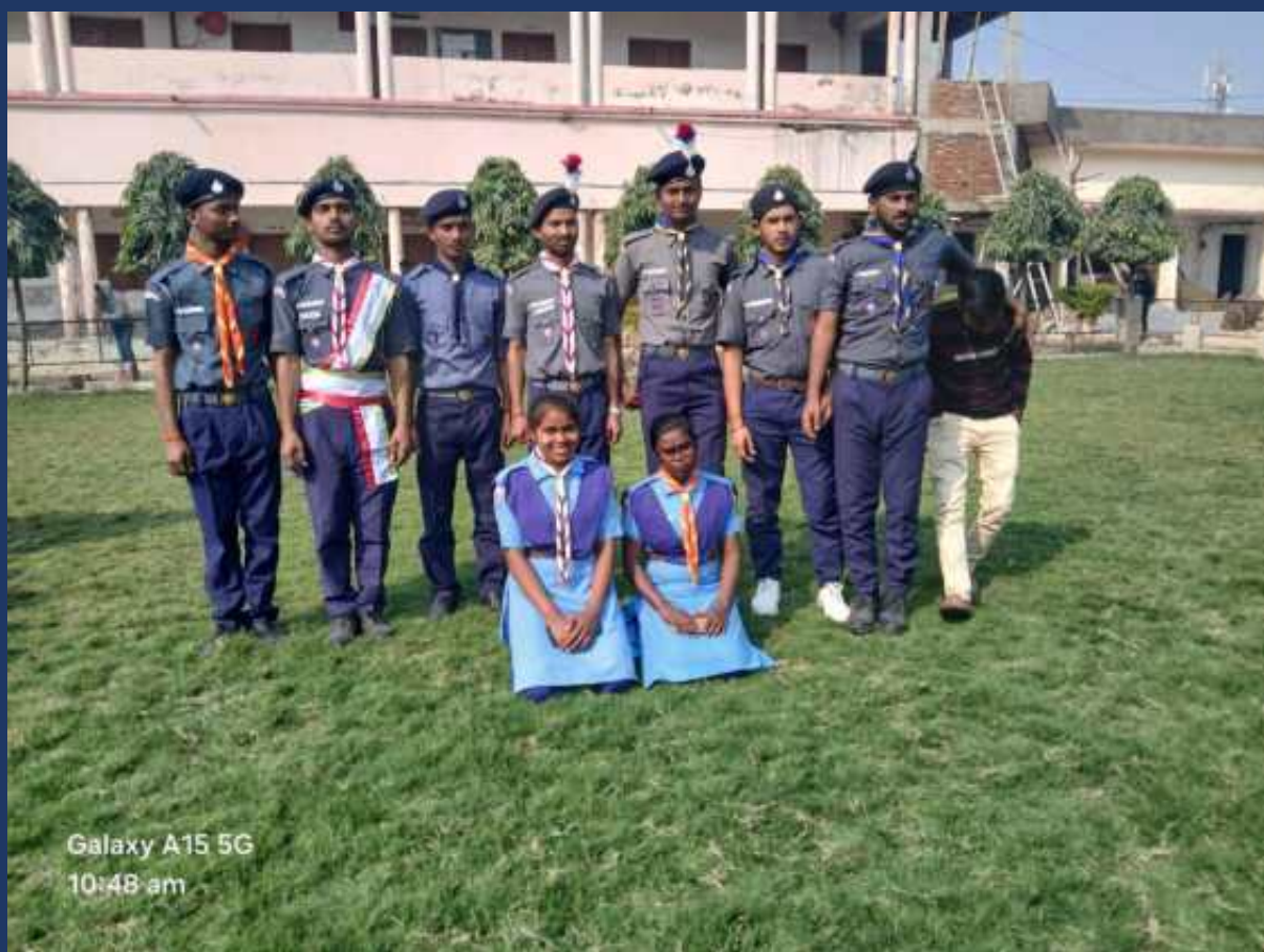
महाविद्यालय के रोवर्स रेंजर्स द्वारा महाविद्यालय में दिनांक 26 जनवरी 2025 को राष्ट्रीय पर्व गड्ढतंत्र दिवस कार्यक्रम