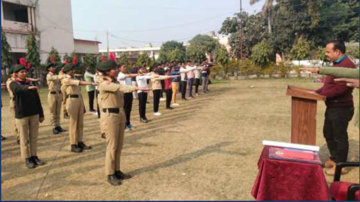
शासन के आदेश के क्रम में महाविद्यालय के रोवर्स रेंजर्स द्वारा महाविद्यालय में दिनांक 5 जनवरी 2023 से 4 फरवरी 2023 तक सड़क सुरक्षा माह कार्यक्रम