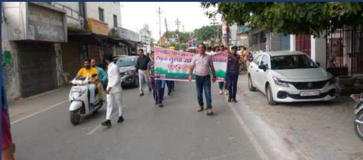
शासन के आदेश के क्रम में महाविद्यालय के रोवर्स रेंजर्स द्वारा महाविद्यालय में दिनांक 21 अक्टूबर २०२३ को सड़क सुरक्षा जागरूकता रैली कार्यक्रम