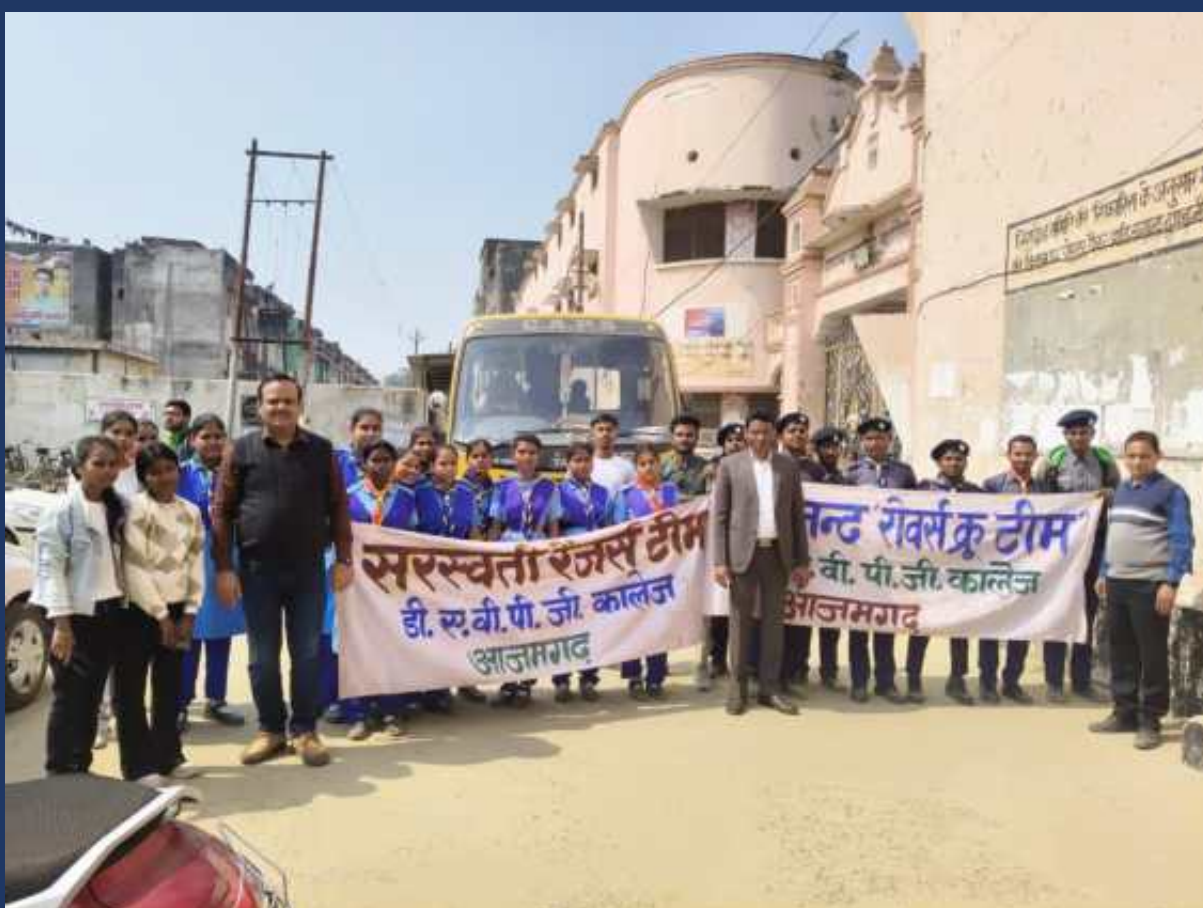
महाविद्यालय के रोवर्स रेंजर्स द्वारा तीन दिवसीय दिनांक (२४, २५, २६ फरवरी २०२५) जनपदीय रोवर्स रेंजर्स समागम में प्रतिभाग करते हुए १३ ट्रॉफी और मैडल प्राप्त किया