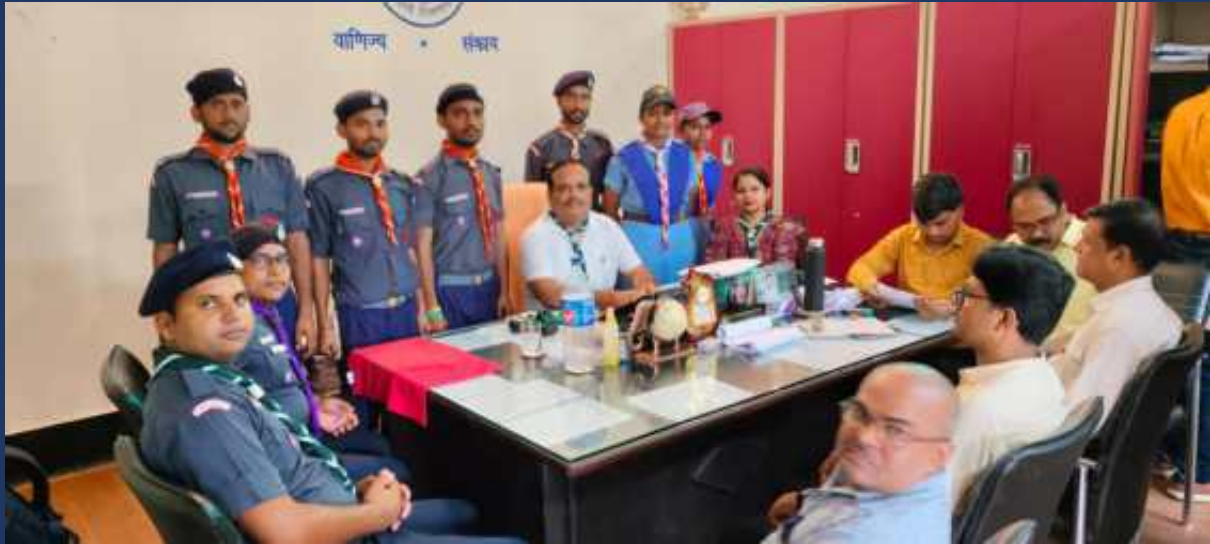
दिनांक 01 अगस्त २०२४ को भारत स्काउट और गाइड, उत्तर प्रदेश द्वारा महाविद्यालय के रोवर्स रेंजर्स के साथ वर्ल्ड स्क्राफ डे कार्यक्रम