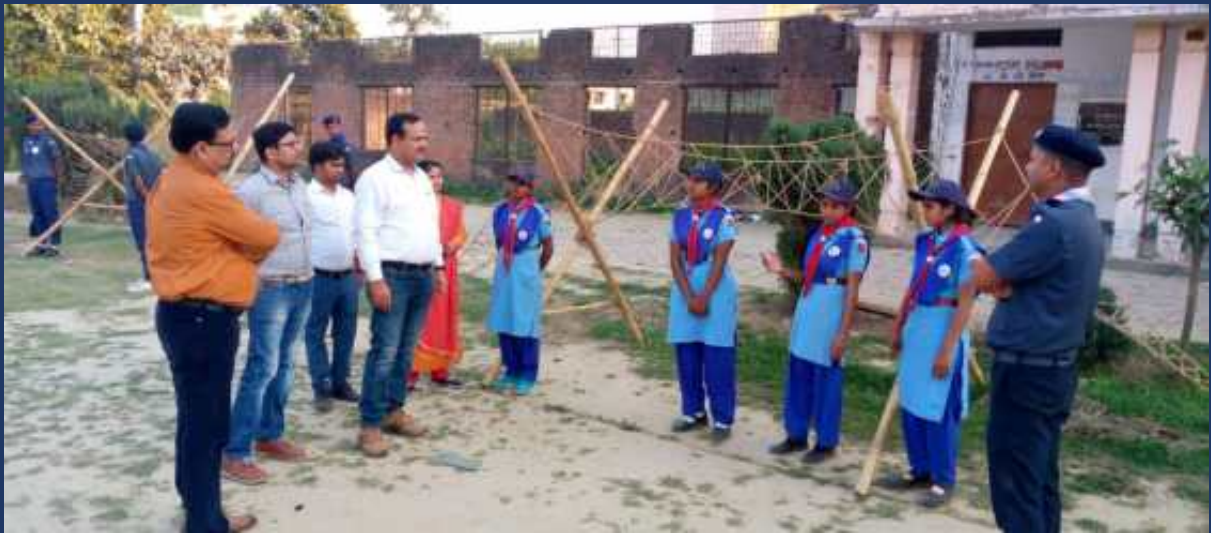
महाविद्यालय में पांच दिवसीय रोवर्स रेंजर्स प्रशिक्षण कार्यक्रम एवं निपुर्ण कैप दिनांक 27 फरवरी 2023 से 03 मार्च 2023 तक