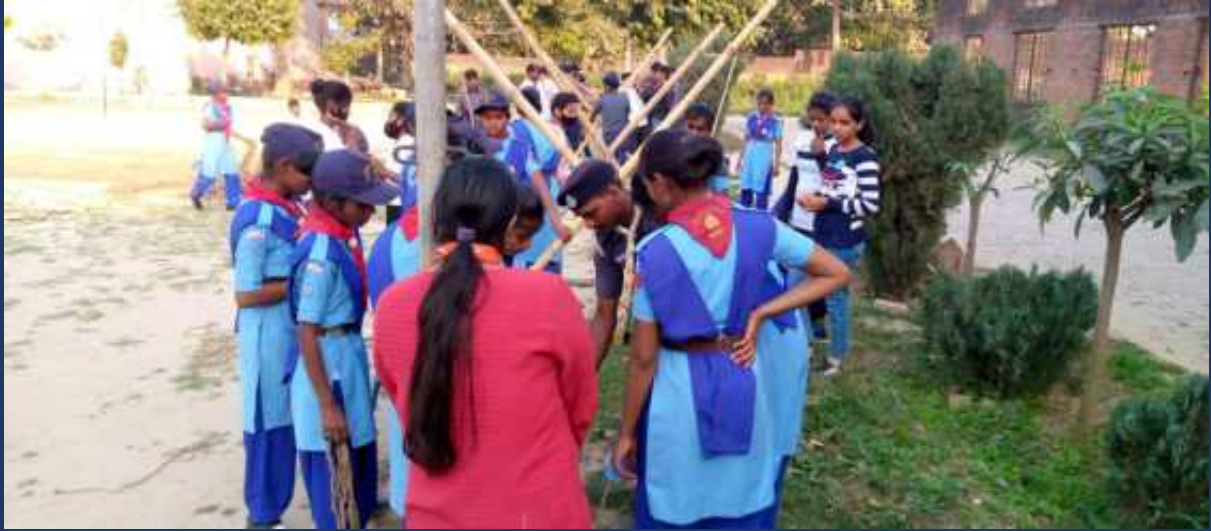
महाविद्यालय में पांच दिवसीय रोवर्स रेंजर्स प्रशिक्षण कार्यक्रम एवं निपुर्ण कैप दिनांक 27 फरवरी 2023 से 03 मार्च 2023 तक