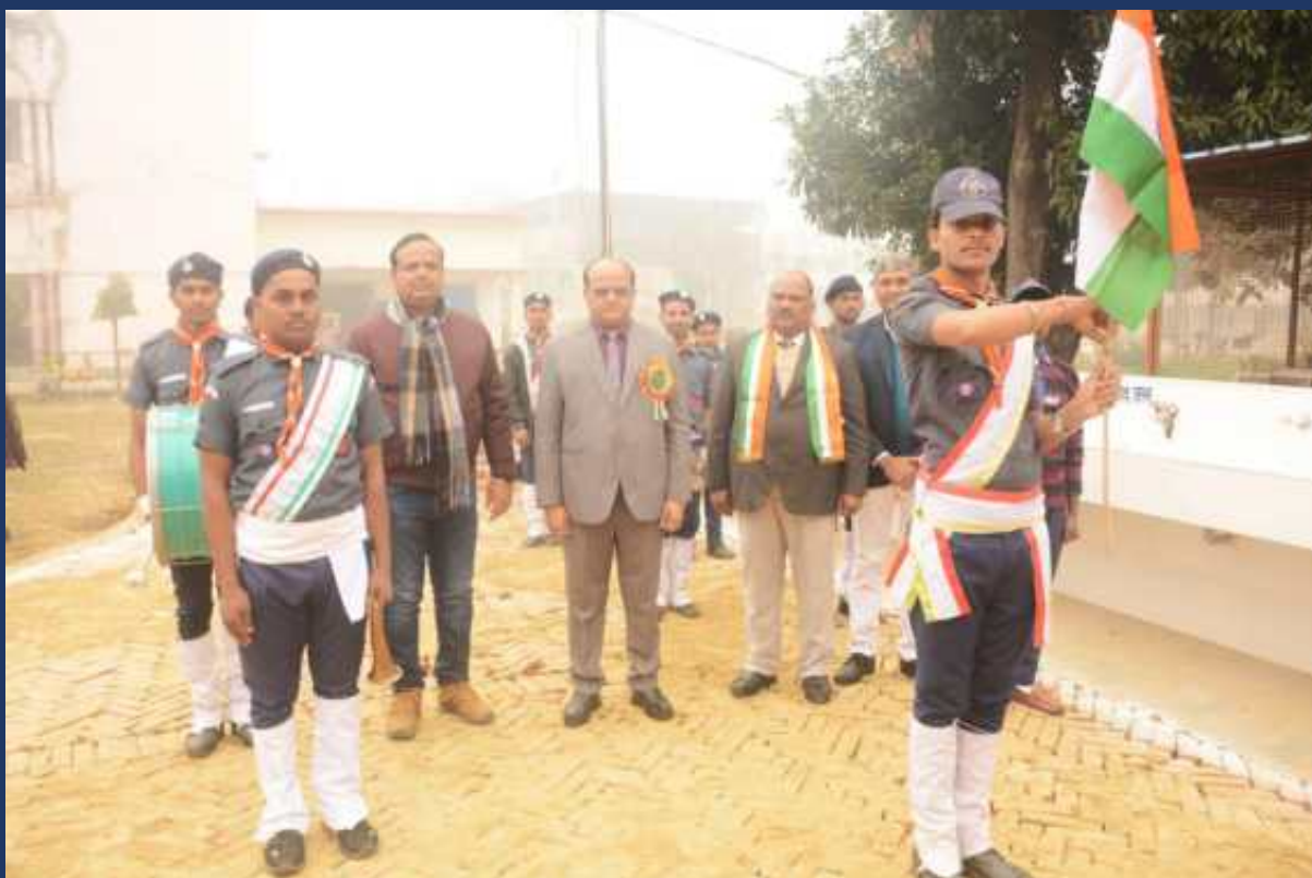
महाविद्यालय के रोवर्स रेंजर्स द्वारा महाविद्यालय में दिनांक 26 जनवरी 2024 को राष्ट्रीय पर्व गङ्गंतत्र दिवस कार्यक्रम