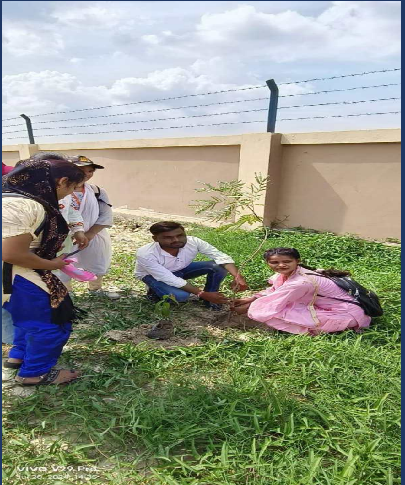
२० जुलाई २०२४ को महाविद्यालय के रोवर्स रेंजर्स द्वारा वृक्षारोपण कार्यक्रम विश्वविद्यालय एवं महाविद्यालय परिसर में