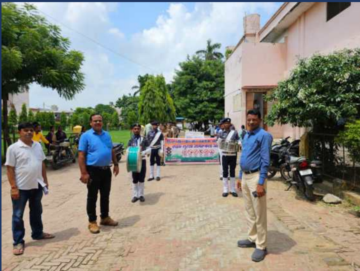
शासन के आदेश के क्रम में महाविद्यालय के रोवर्स रेंजर्स द्वारा महाविद्यालय में दिनांक 31 जुलाई २०२३ को सड़क सुरक्षा जागरूगता रैली कार्यक्रम