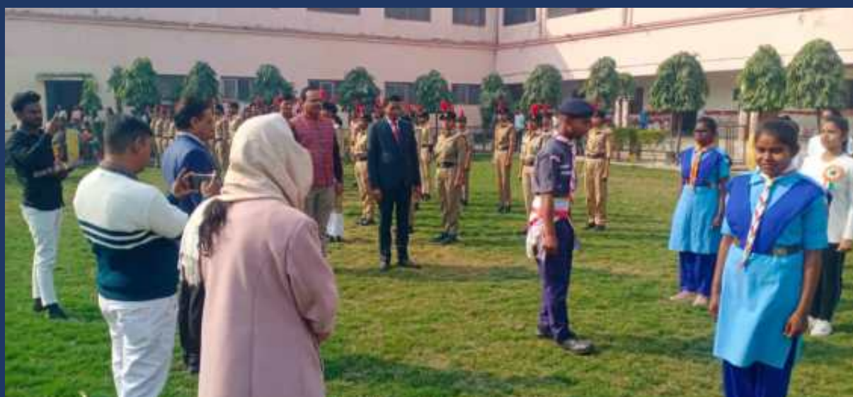
महाविद्यालय के रोवर्स रेंजर्स द्वारा महाविद्यालय में दिनांक 26 जनवरी 2025 को राष्ट्रीय पर्व गड्ढतंत्र दिवस कार्यक्रम