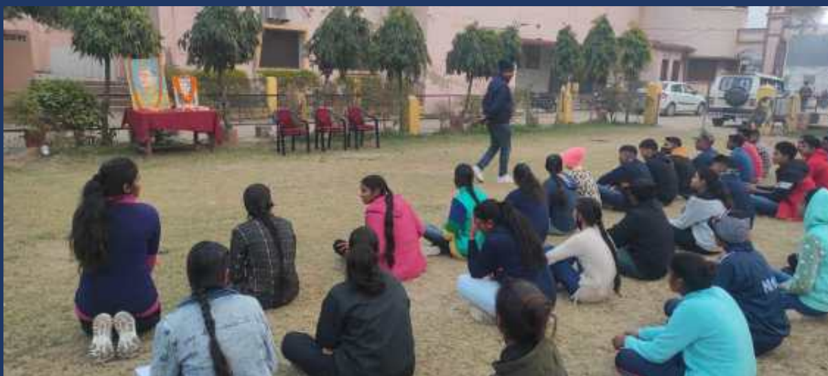
महाविद्यालय के रोवर्स रेंजर्स द्वारा महाविद्यालय में दिनांक 23 जनवरी 2023 को सुभाष चन्द्र बोस जयन्ती कार्यक्रम