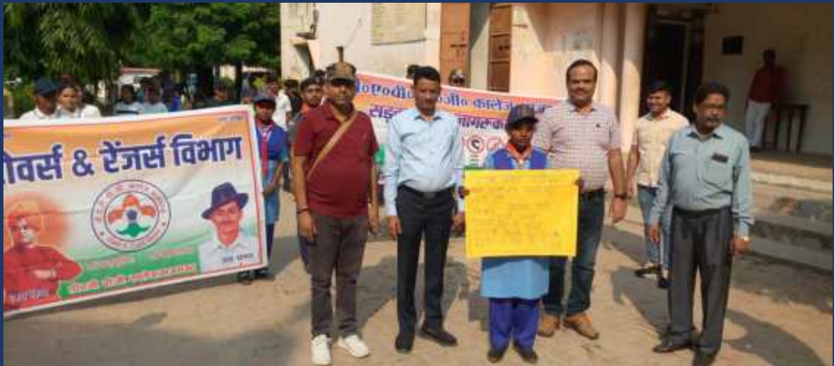
शासन के आदेश के क्रम में महाविद्यालय के रोवर्स रेंजर्स द्वारा महाविद्यालय में दिनांक 21 अक्टूबर २०२३ को सड़क सुरक्षा जागरूकता रैली कार्यक्रम