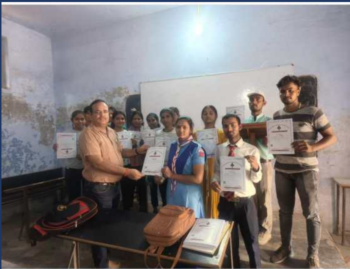
महाविद्यालय में संचालित पांच दिवसीय रोवर्स रेंजर्स प्रशिक्षण कार्यक्रम एवं निपुर्ण कैप दिनांक 27 फरवरी 2023 से 03 मार्च 2023 का प्रमाण पत्र वितरण