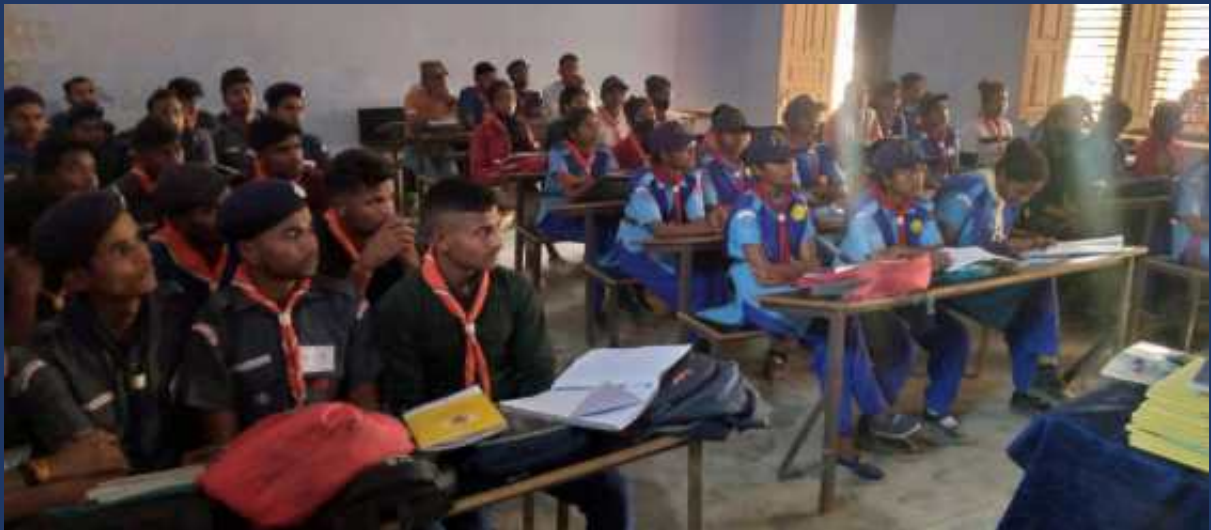
महाविद्यालय में पांच दिवसीय रोवर्स रेंजर्स प्रशिक्षण कार्यक्रम एवं निपुण कैंप दिनांक 27 फरवरी 2023 से 03 मार्च 2023 तक