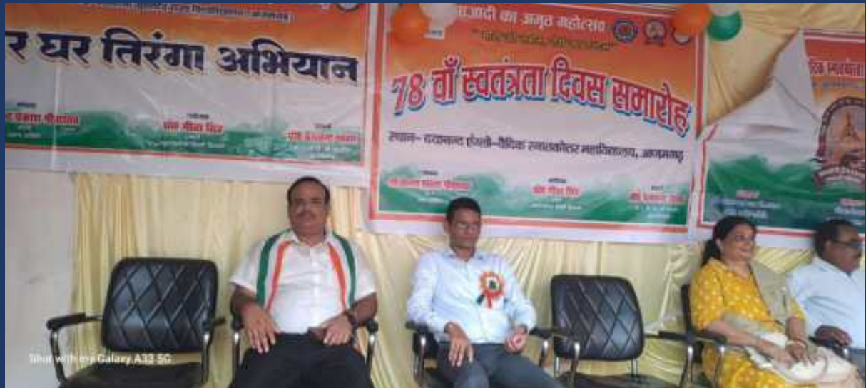
महाविद्यालय के रोवर्स रेंजर्स द्वारा महाविद्यालय में दिनांक 15 अगस्त 2024 को राष्ट्रीय पर्व स्वतंत्रता दिवस कार्यक्रम