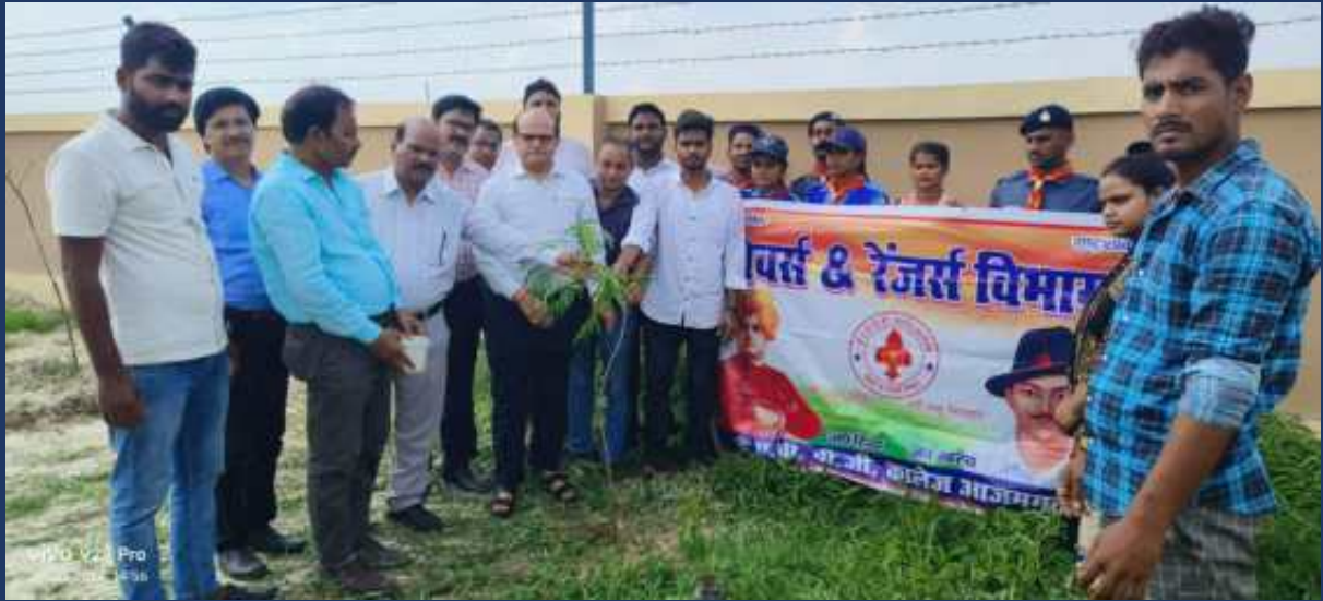
२० जुलाई २०२४ को महाविद्यालय के रोवर्स रेंजर्स द्वारा वृक्षारोपण कार्यक्रम विश्वविद्यालय एवं महाविद्यालय परिसर में