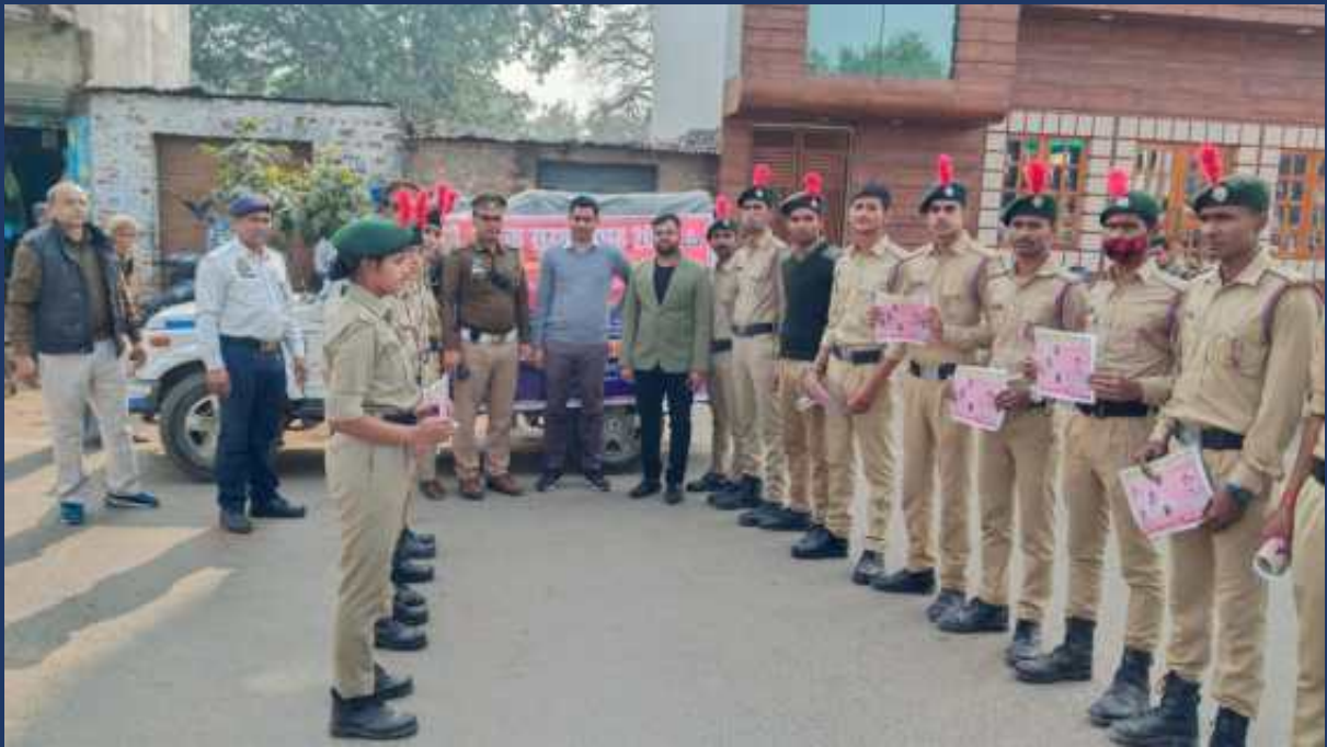
शासन के आदेश के क्रम में महाविद्यालय के रोवर्स रेंजर्स द्वारा महाविद्यालय में दिनांक 5 जनवरी 2023 से 4 फरवरी 2023 तक सड़क सुरक्षा माह कार्यक्रम