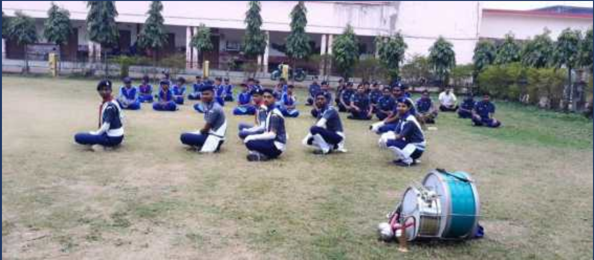
महाविद्यालय के रोवर्स रेंजर्स द्वारा महाविद्यालय में दिनांक 26 जनवरी 2023 को राष्ट्रीय पर्व गङ्गोत्री दिवस कार्यक्रम