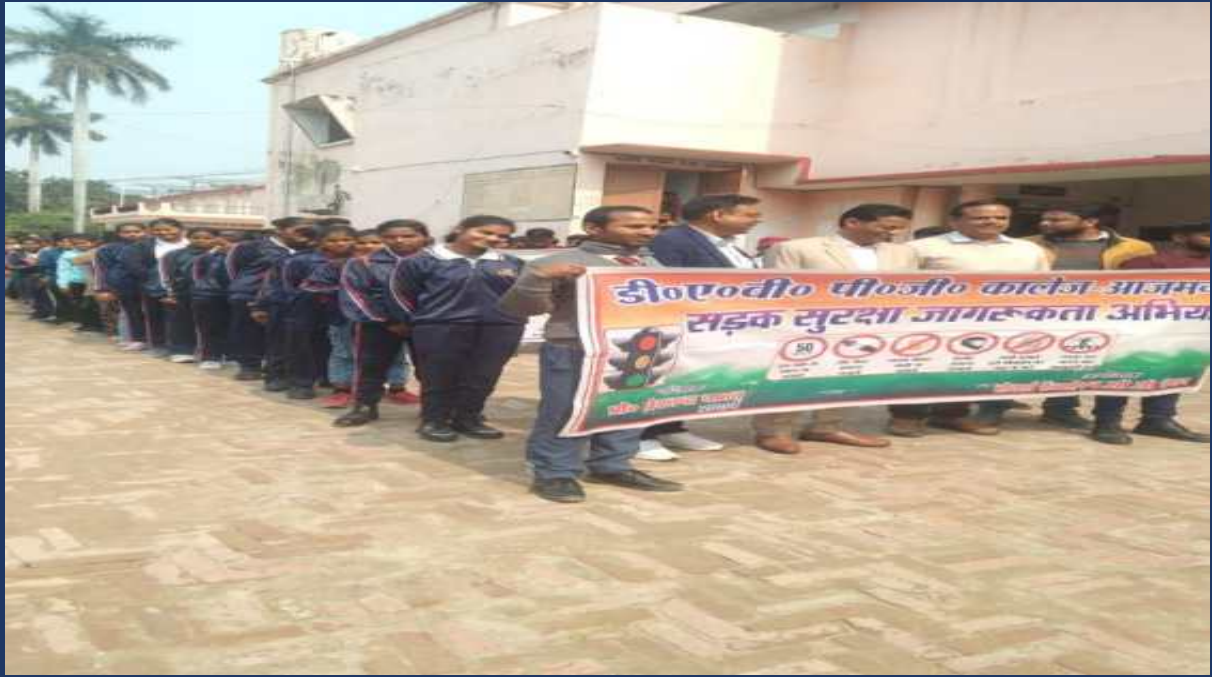
शासन के आदेश के क्रम में महाविद्यालय के रोवर्स रेंजर्स द्वारा महाविद्यालय में दिनांक 13 फ़रवरी २०२4 को सड़क सुरक्षा जागरूकता रैली कार्यक्रम