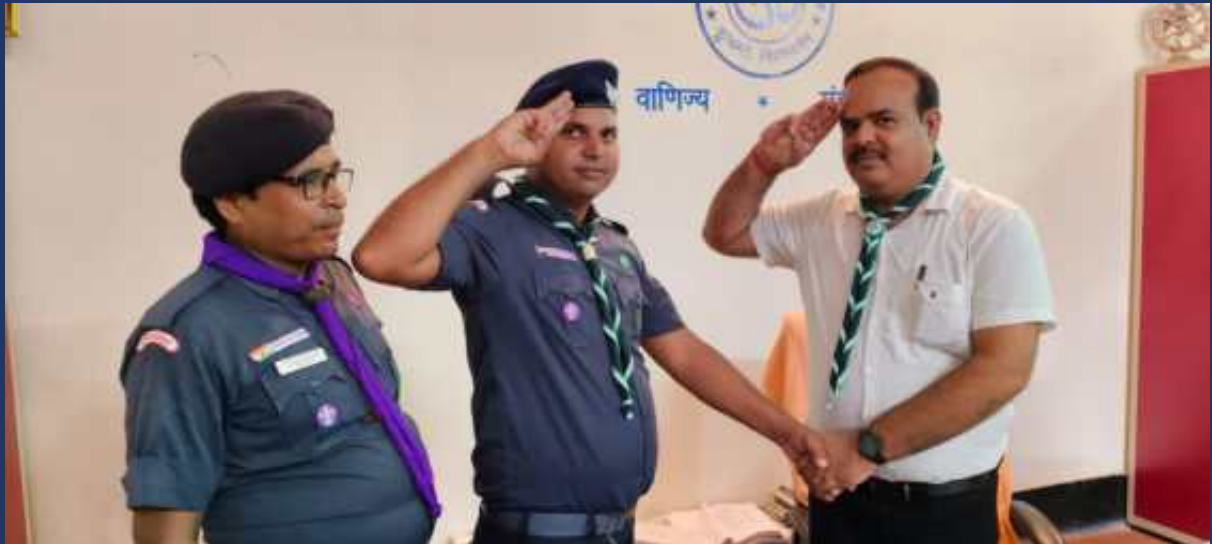
दिनांक 01 अगस्त २०२४ को भारत स्काउट और गाइड, उत्तर प्रदेश द्वारा महाविद्यालय के रोवर्स रेंजर्स के साथ वर्ल्ड स्क्राफ डे कार्यक्रम