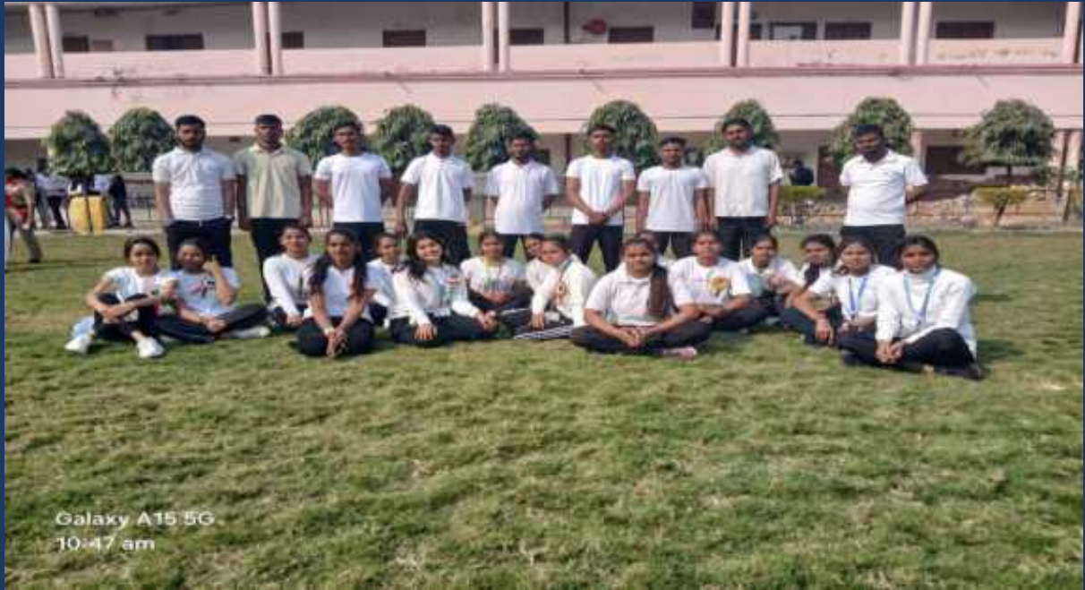
महाविद्यालय के रोवर्स रेंजर्स द्वारा महाविद्यालय में दिनांक 26 जनवरी 2025 को राष्ट्रीय पर्व गङ्गंतंत्र दिवस कार्यक्रम