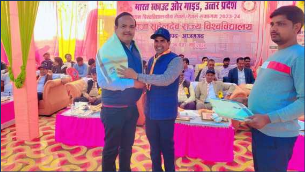
भारत स्काउट एवं गाइड उत्तर प्रदेश के वार्षिक कार्यक्रम के अनुसार महाराजा सुहेल देव विश्वविधालय आजमगढ़ का दिनांक(06 ,07 मार्च 2024) को प्रथम विश्वविद्यालय रोवर्स रेंजर्स समागम कार्यक्रम