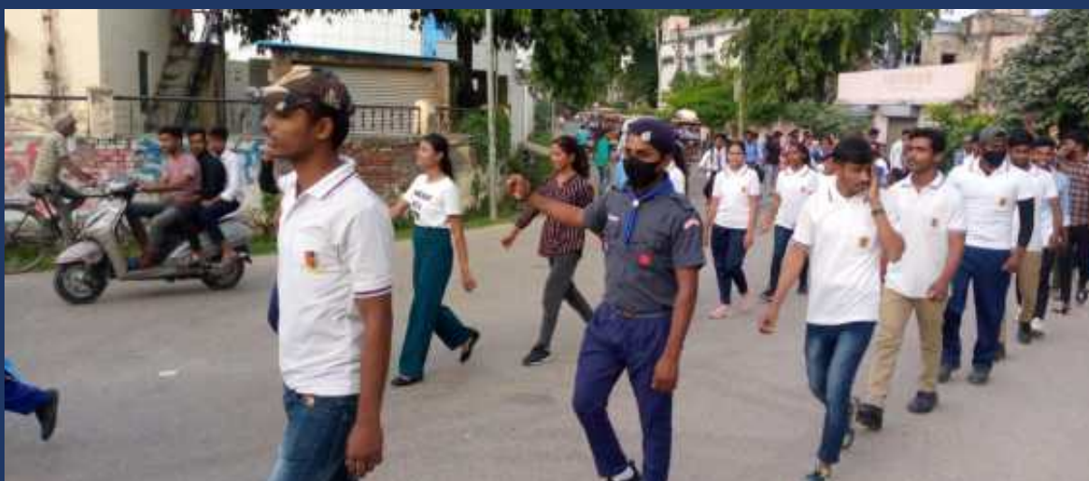
शासन के आदेश के क्रम में महाविद्यालय के रोवर्स रेंजर्स द्वारा महाविद्यालय में दिनांक 31 जुलाई २०२३ को सड़क सुरक्षा जागरूगता रैली कार्यक्रम