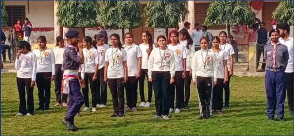
महाविद्यालय के रोवर्स रेंजर्स द्वारा महाविद्यालय में दिनांक 26 जनवरी 2025 को राष्ट्रीय पर्व गङ्गोत्री दिवस कार्यक्रम