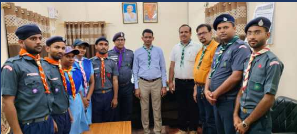
दिनांक 01 अगस्त २०२४ को भारत स्काउट और गाइड, उत्तर प्रदेश द्वारा महाविद्यालय के रोवर्स रेंजर्स के साथ वर्ल्ड स्क्राफ डे कार्यक्रम