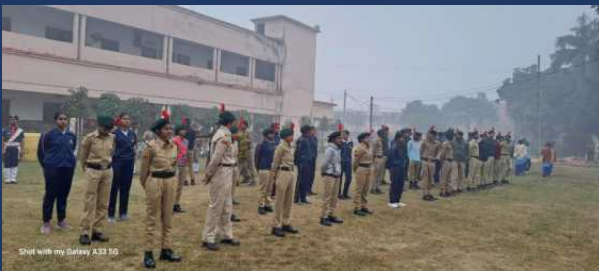
महाविद्यालय के रोवर्स रेंजर्स द्वारा महाविद्यालय में दिनांक 26 जनवरी 2024 को राष्ट्रीय पर्व गङ्गंतत्र दिवस कार्यक्रम