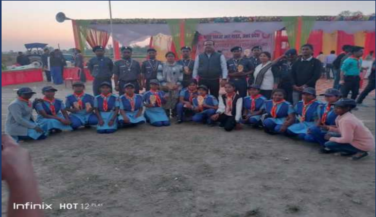
भारत स्काउट एवं गाइड उत्तर प्रदेश के वार्षिक कार्यक्रम के अनुसार महाराजा सुहेल देव विश्वविधालय आजमगढ़ का दिनांक(06 ,07 मार्च 2024) को प्रथम विश्वविद्यालय रोवर्स रैंजर्स समागम कार्यक्रम