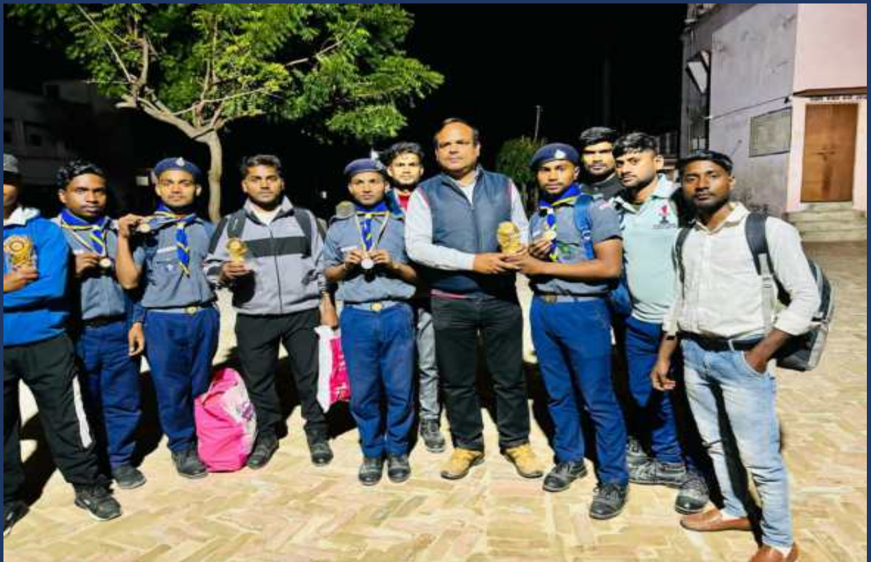
भारत स्काउट एवं गाइड उत्तर प्रदेश के वार्षिक कार्यक्रम के अनुसार महाराजा सुहेल देव विश्वविधालय आजमगढ़ का दिनांक(06 ,07 मार्च 2024) को प्रथम विश्वविद्यालय रोवर्स रैंजर्स समागम कार्यक्रम