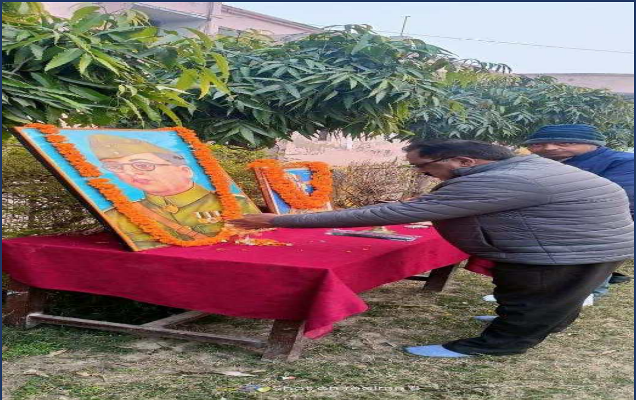
महाविद्यालय के रोवर्स रेंजर्स द्वारा महाविद्यालय में दिनांक 23 जनवरी 2023 को सुभाष चन्द्र बोस जयन्ती कार्यक्रम