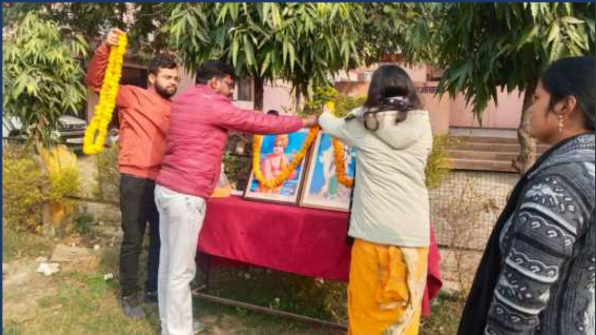
महाविद्यालय में दिनांक 12 जनवरी 2023 को राष्ट्रीय युवा दिवस (स्वामी विवेकानन्द जयन्ती) कार्यक्रम