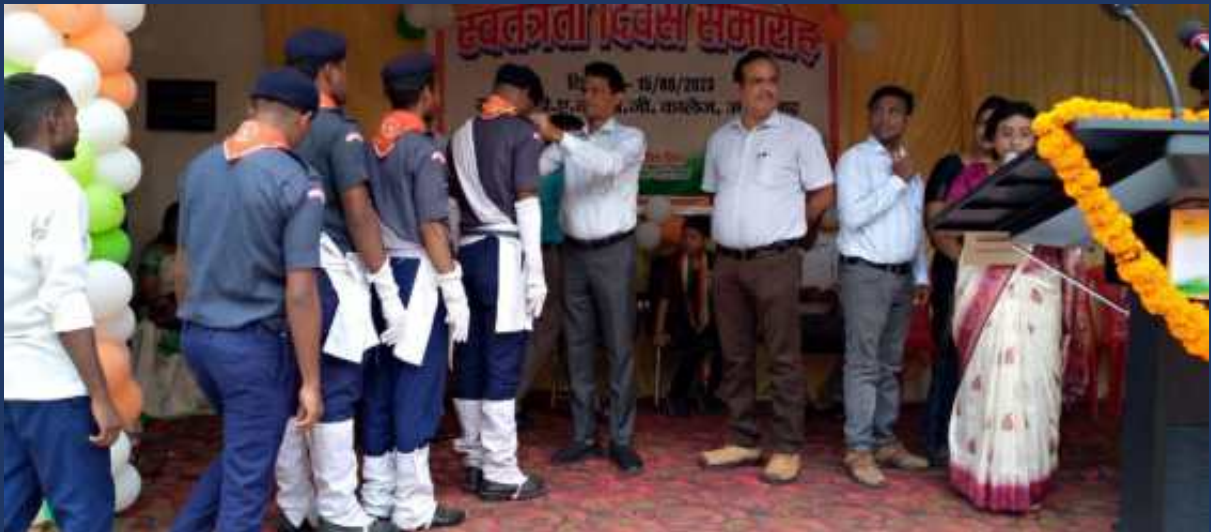
महाविद्यालय के रोवर्स रेंजर्स द्वारा महाविद्यालय में दिनांक 15 अगस्त 2023 को राष्ट्रीय पर्व स्वतंत्रता दिवस कार्यक्रम