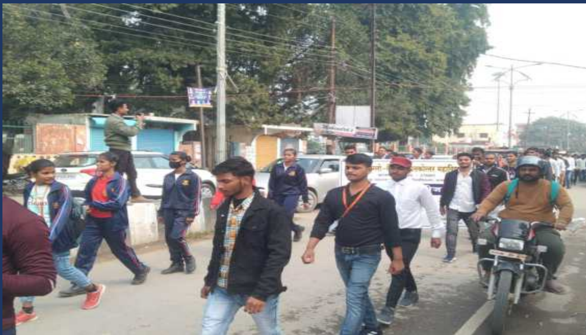
शासन के आदेश के क्रम में महाविद्यालय के रोवर्स रेंजर्स द्वारा महाविद्यालय में दिनांक 13 फ़रवरी २०२4 को सड़क सुरक्षा जागरूगता रैली कार्यक्रम