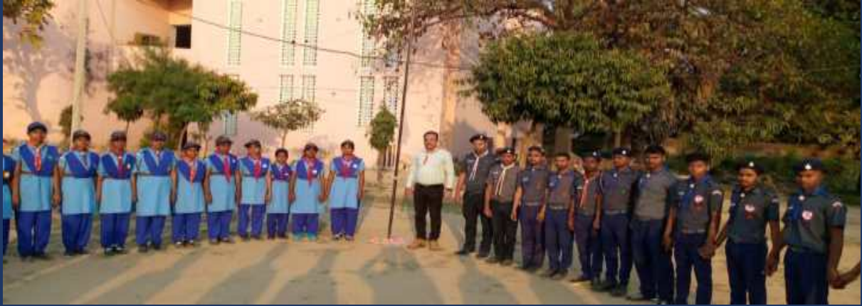
महाविद्यालय में पांच दिवसीय रोवर्स रेंजर्स प्रशिक्षण कार्यक्रम एवं निपुर्ण कैप दिनांक 27 फरवरी 2023 से 03 मार्च 2023 तक