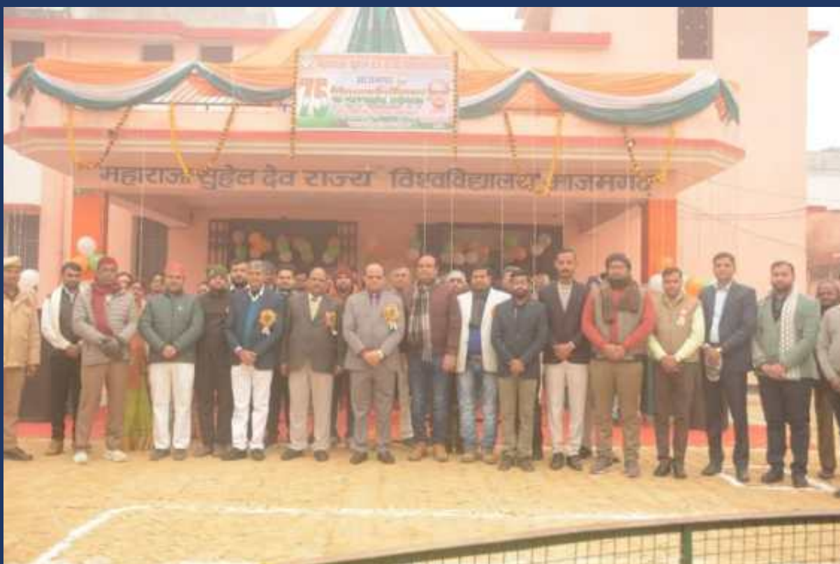
महाविद्यालय के रोवर्स रेंजर्स द्वारा महाविद्यालय में दिनांक 26 जनवरी 2023 को राष्ट्रीय पर्व गड्ढतंत्र दिवस कार्यक्रम