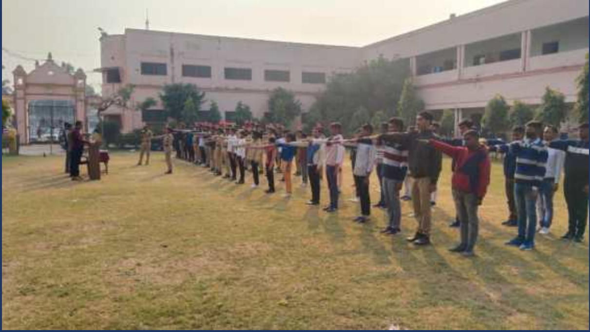
शासन के आदेश के क्रम में महाविद्यालय के रोवर्स रेंजर्स द्वारा महाविद्यालय में दिनांक 5 जनवरी 2023 से 4 फरवरी 2023 तक सड़क सुरक्षा माह कार्यक्रम