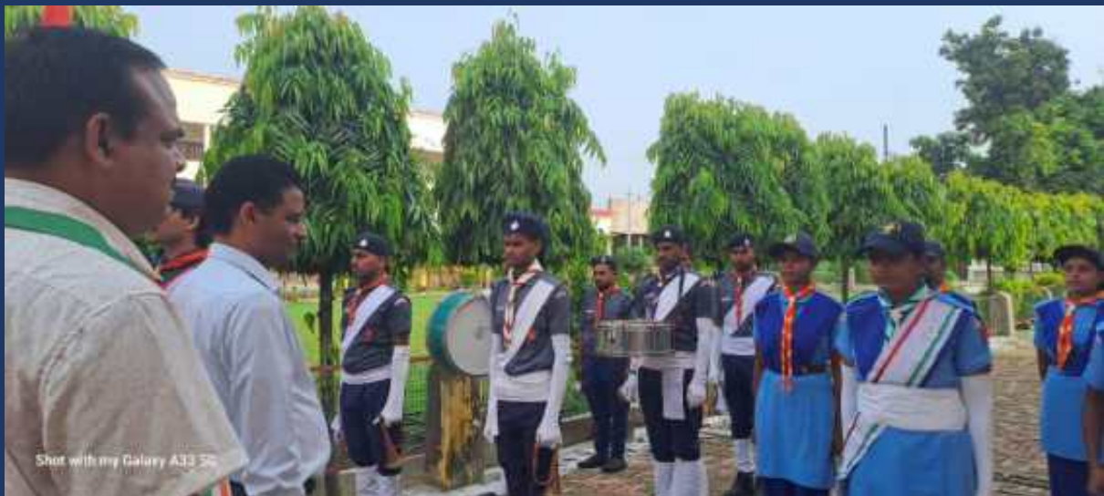
महाविद्यालय के रोवर्स रेंजर्स द्वारा महाविद्यालय में दिनांक 15 अगस्त 2024 को राष्ट्रीय पर्व स्वतंत्रा दिवस कार्यक्रम