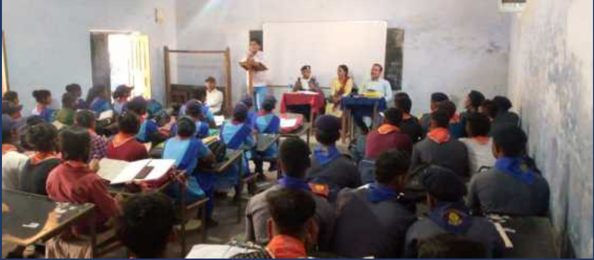
महाविद्यालय में पांच दिवसीय रोवर्स रेंजर्स प्रशिक्षण कार्यक्रम एवं निपुर्ण कैंप दिनांक 27 फरवरी 2023 से 03 मार्च 2023 तक