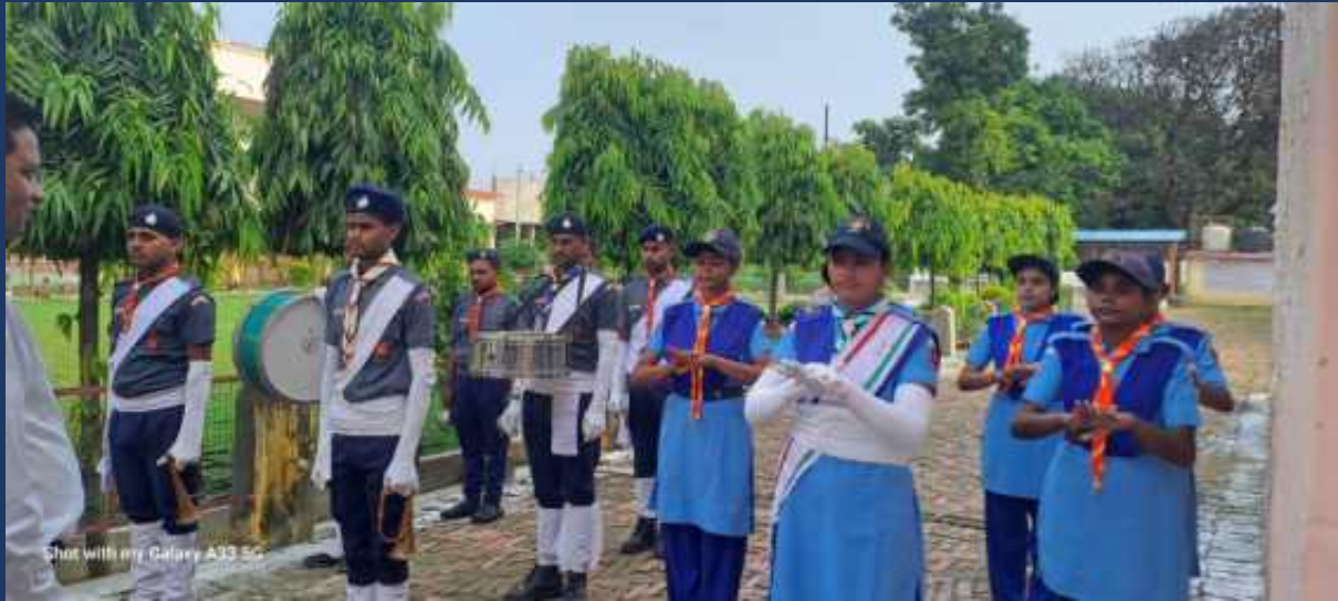
महाविद्यालय के रोवर्स रेंजर्स द्वारा महाविद्यालय में दिनांक 15 अगस्त 2024 को राष्ट्रीय पर्व स्वतंत्रा दिवस कार्यक्रम