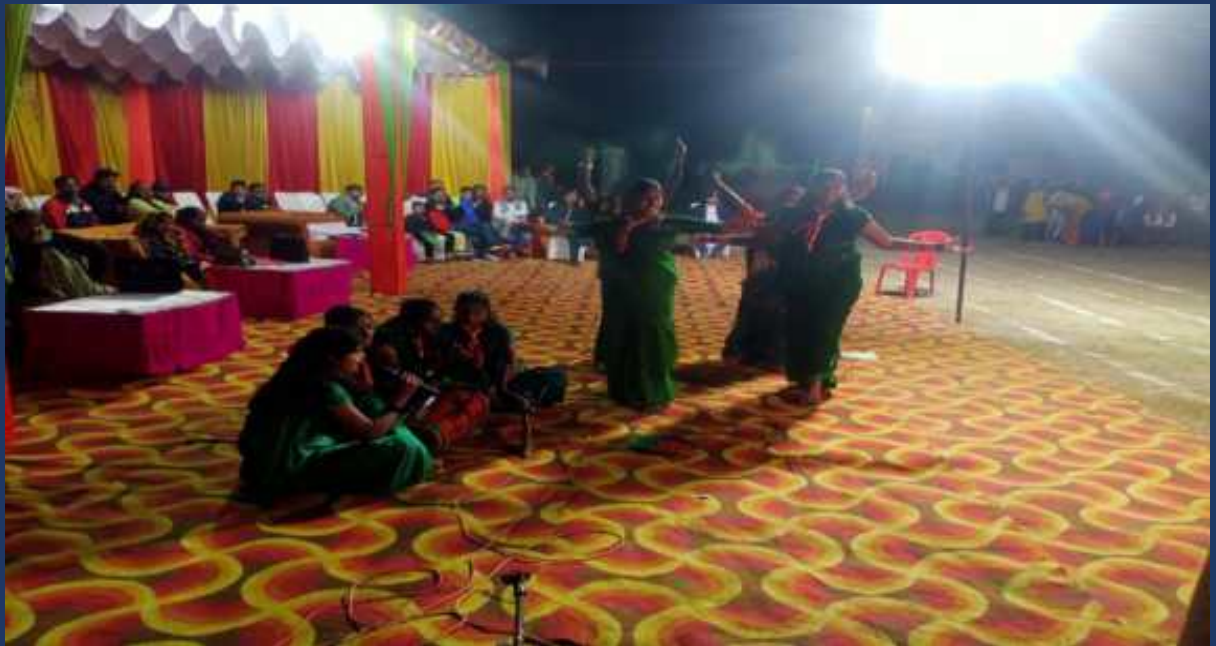
भारत स्काउट एवं गाइड उत्तर प्रदेश के वार्षिक कार्यक्रम के अनुसार महाराजा सुहेल देव विश्वविधालय आजमगढ़ का दिनांक(06 ,07 मार्च 2024) को प्रथम विश्वविद्यालय रोवर्स रेंजर्स समागम कार्यक्रम