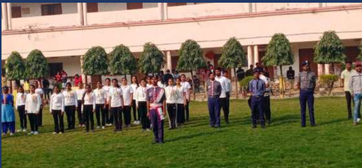
महाविद्यालय के रोवर्स रेंजर्स द्वारा महाविद्यालय में दिनांक 26 जनवरी 2025 को राष्ट्रीय पर्व गड्ढा दिवस कार्यक्रम