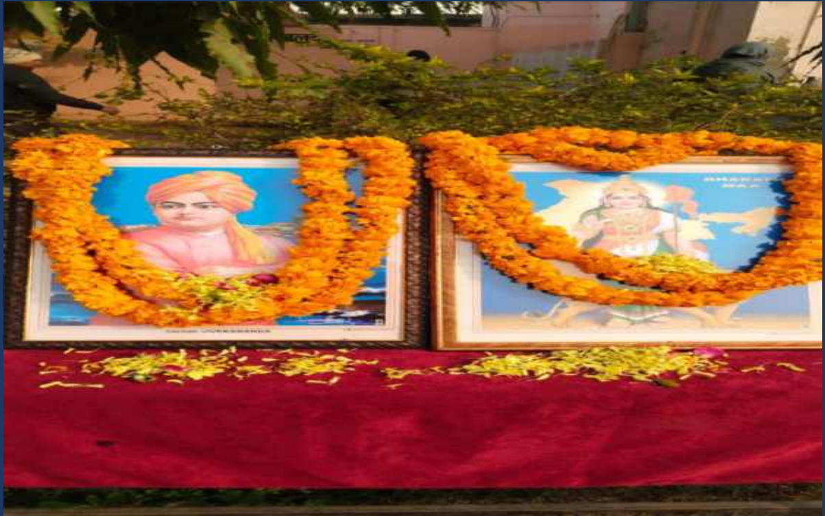
महाविद्यालय में दिनांक 12 जनवरी 2023 को राष्ट्रीय युवा दिवस (स्वामी विवेकानन्द जयन्ती ) कार्यक्रम